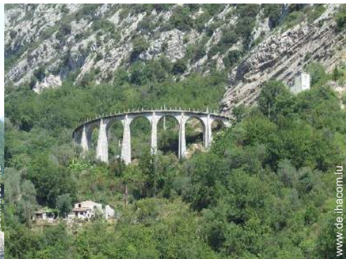
Via ferrata (Klettersteig)