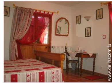
Raumaufteilung zur Verfügung der Gäste

Terrasse 20m 2 , überdachte Terrasse 30m 2 , Gartentisch(e), 6 Gartenstuhl/-stühle, Laube, Sonnenschirm, 4 Liegestuhl/-stühle, Hollywoodschaukel