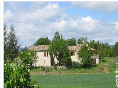
provenzalisches Haus mit Charme