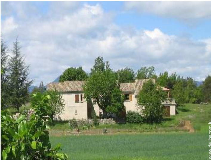
provenzalisches Haus mit Charme