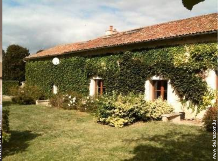
Charakterhaus mit Charme