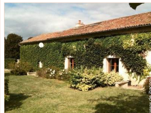
Charakterhaus mit Charme