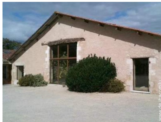
Charakterhaus mit Charme