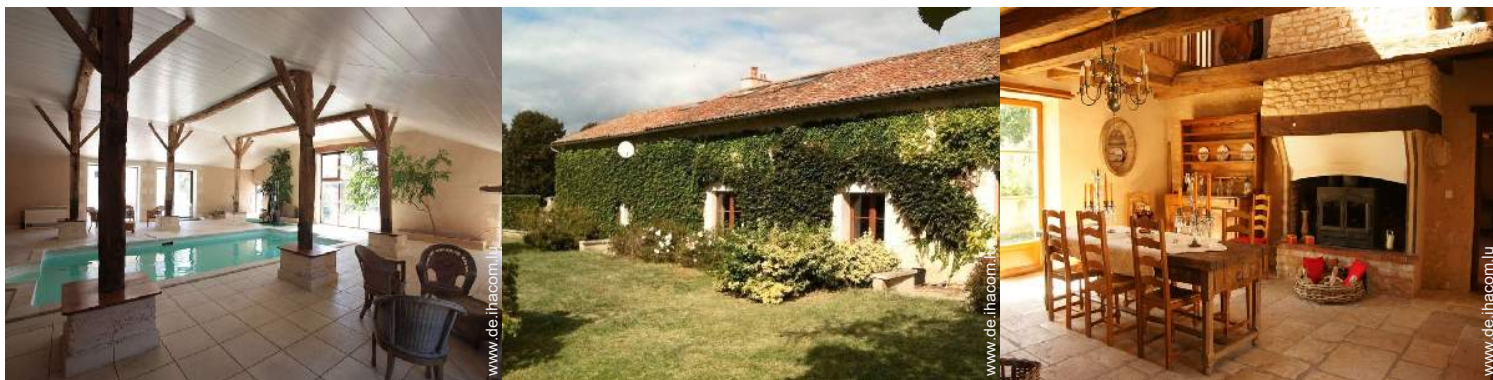
Charakterhaus mit Charme