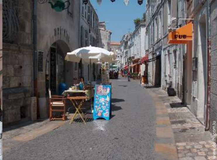
Blick auf Fußgängerzone