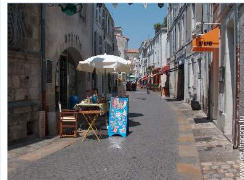
Blick auf Fußgängerzone