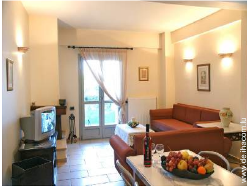
Innenkomfort und Ausstattung