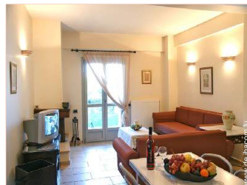
Innenkomfort und Ausstattung