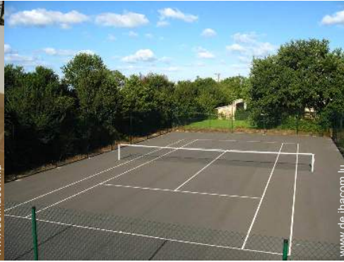
Tennisplatz - harter Belag