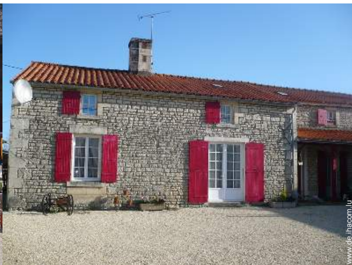
ehem. Bauernhaus mit Charme