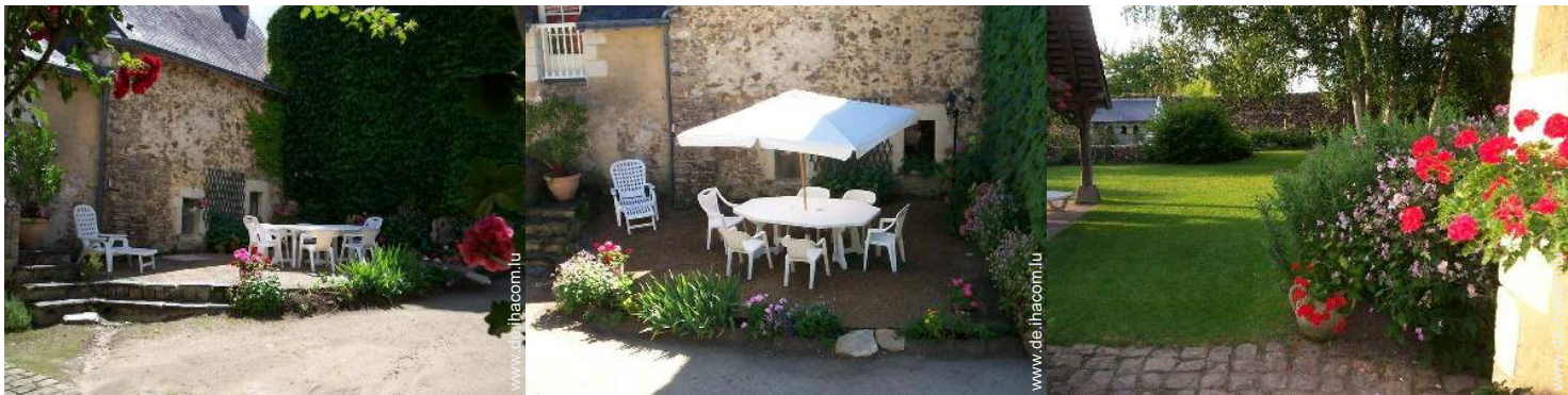
Äußerer Rahmen zur Verfügung der Gäste