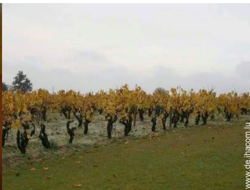
Blick auf Weinberge