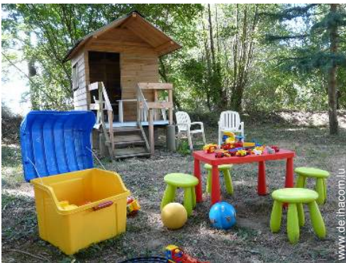
Außenausstattung zur Verfügung der Gäste