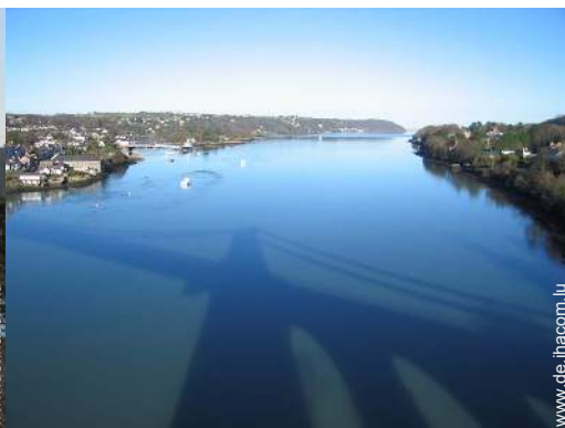
Badevergnügen in der Nähe