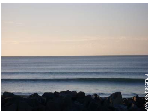
Badevergnügen in der Nähe