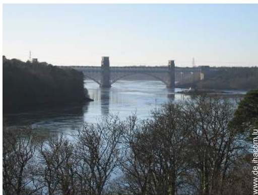
Wassersport in der Nähe