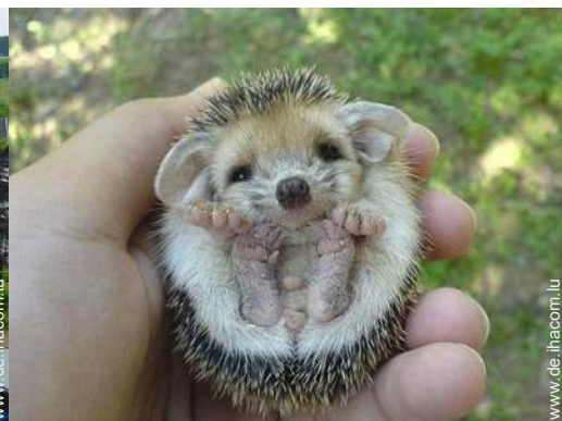
Park und Garten