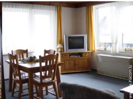
Innenkomfort und Ausstattung