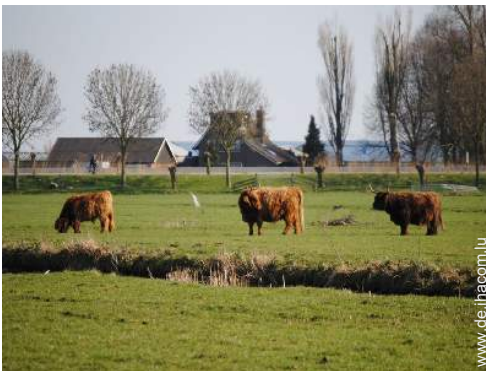
Blick auf Wiese