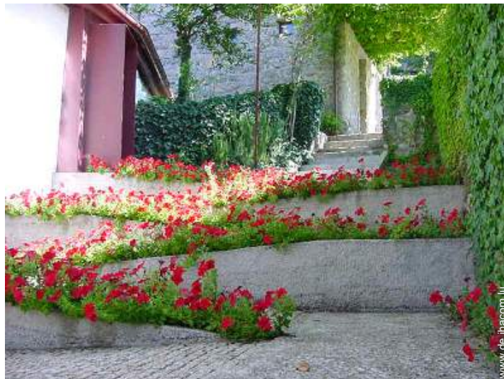
Anwesen mit Charme