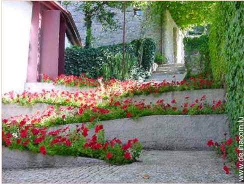
Anwesen mit Charme