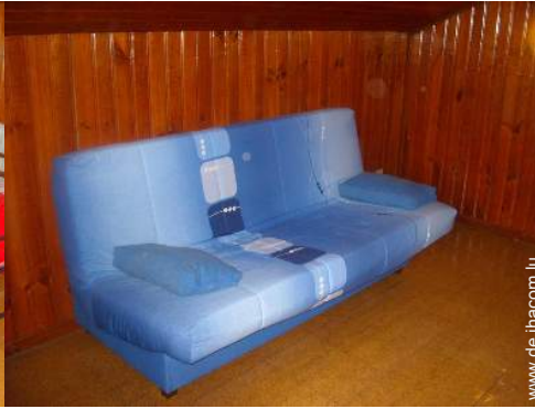
Schrankbett(en) 2 Personen