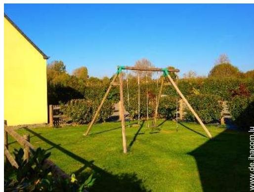
Außenausstattung zur Verfügung der Gäste