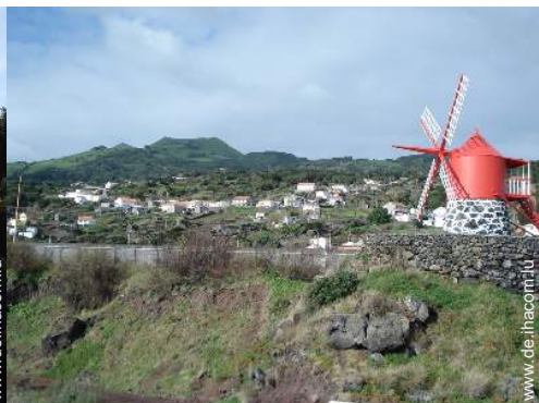
Antiquitäten & Trödel