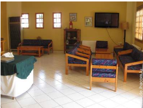
Wi-Fi (drahtloser Internetzugang)