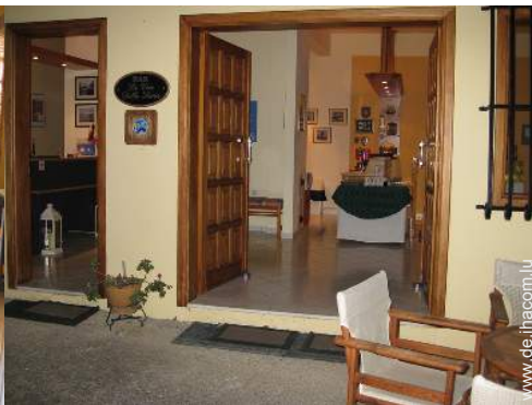
Wi-Fi (drahtloser Internetzugang)