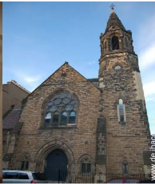
ehem. Kapelle mit Charme