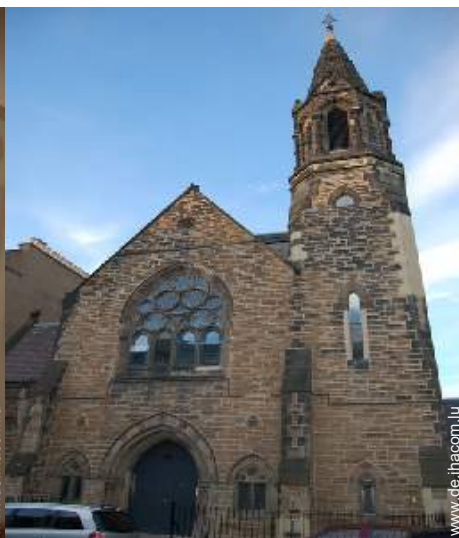
ehem. Kapelle mit Charme