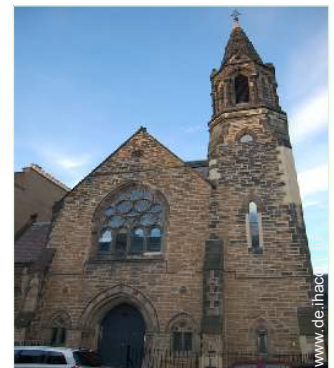
ehem. Kapelle mit Charme