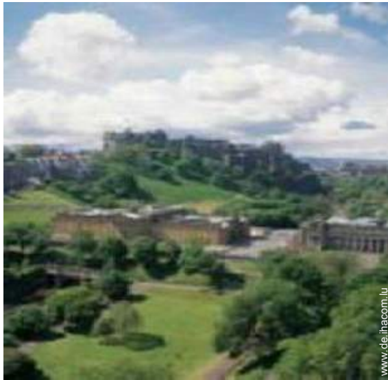
Blick auf Stadtzentrum