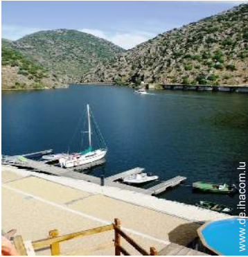
Blick auf See