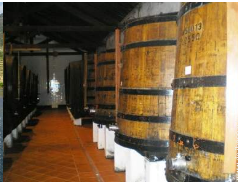
Weinkeller und Weindegustation