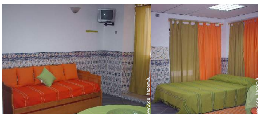
Ausziehbett(en) 1 Person