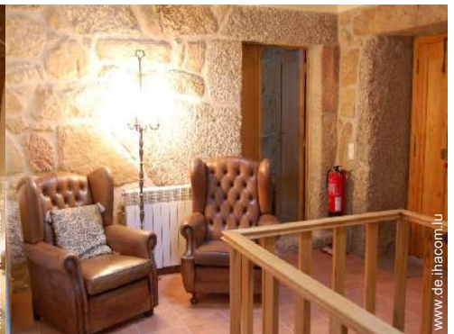
Innenkomfort zur Verfügung der Gäste