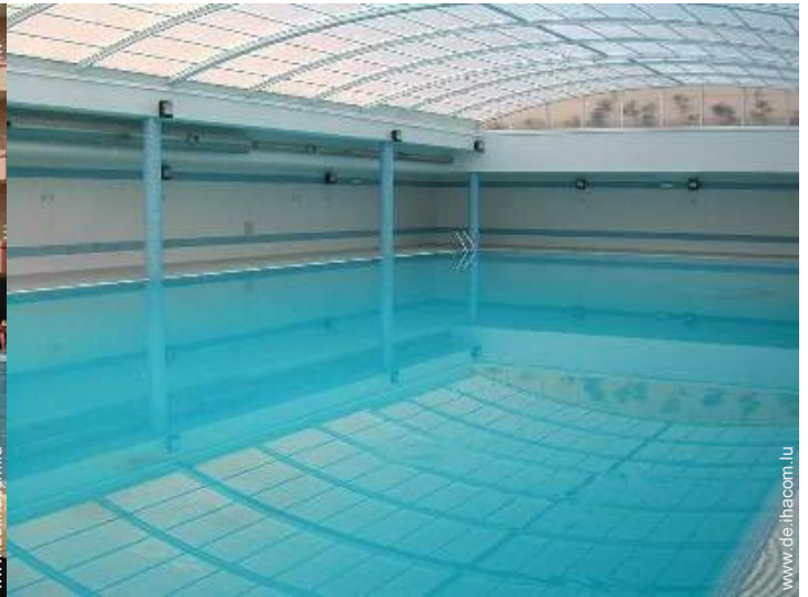
Swimmingpool im Haus