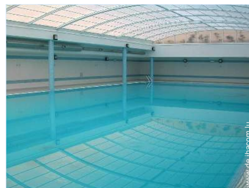
Swimmingpool im Haus