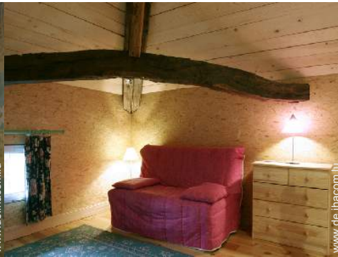
Schrankbett(en) 2 Personen