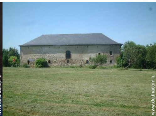
Blick auf Wiese