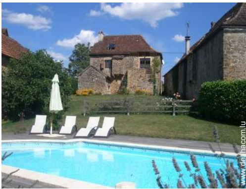
Charakterhaus mit Charme