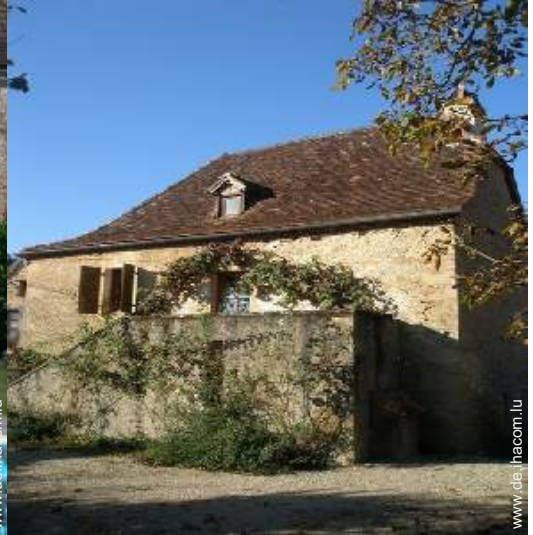
Charakterhaus mit Charme