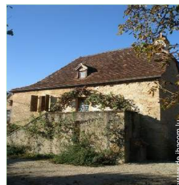
Charakterhaus mit Charme