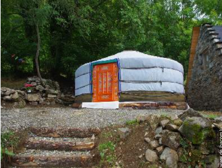
Jurte (mongolisches Zelt)