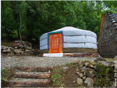
Jurte (mongolisches Zelt)