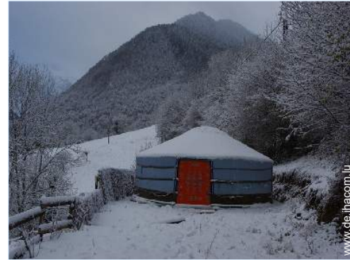
Jurte (mongolisches Zelt)