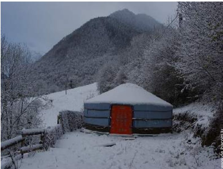
Jurte (mongolisches Zelt)