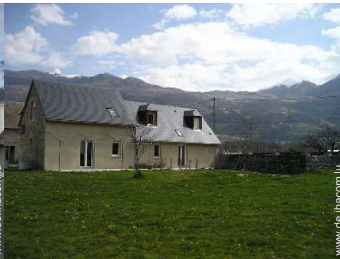
Blick auf Wiese