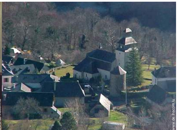
Blick auf Dorfzentrum