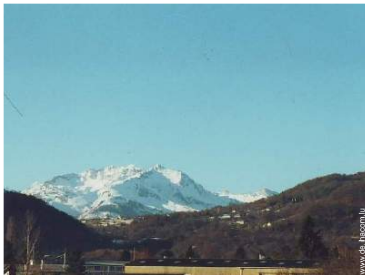
Blick auf Dorf