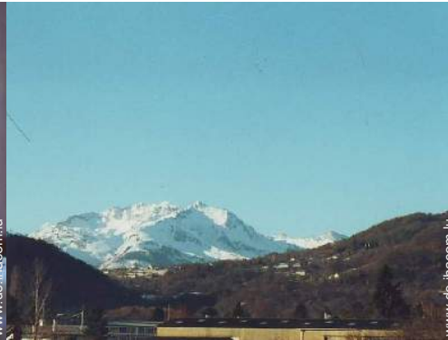
Blick auf Dorf