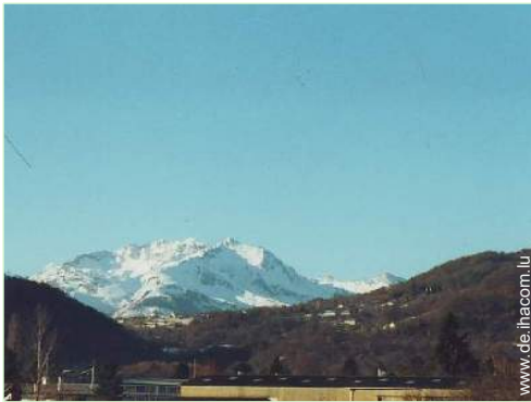
Blick auf Dorf