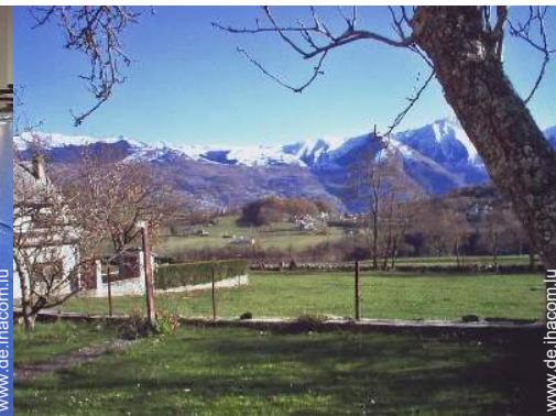
Blick auf Gebirge