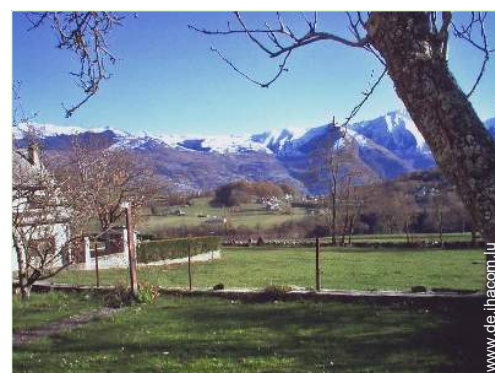
Blick auf Gebirge