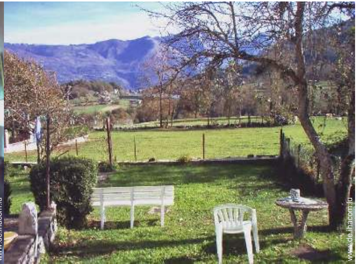
Blick auf See