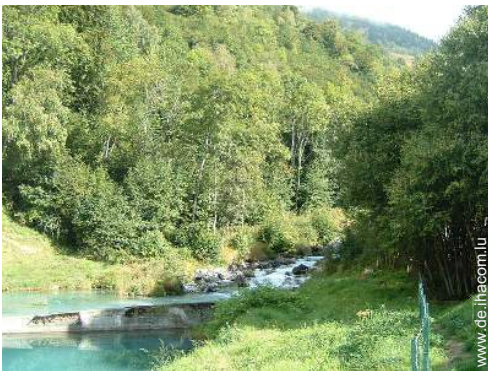
Blick auf Fluss