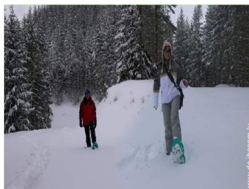
Winteraktivitäten in der Nähe