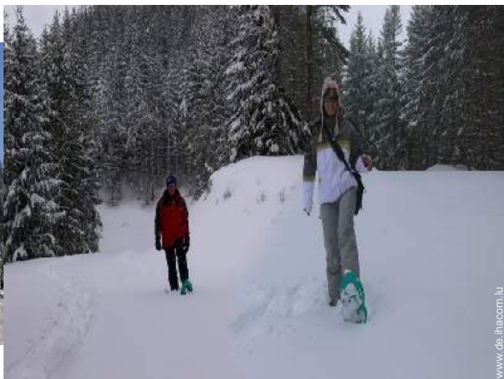
Winteraktivitäten in der Nähe