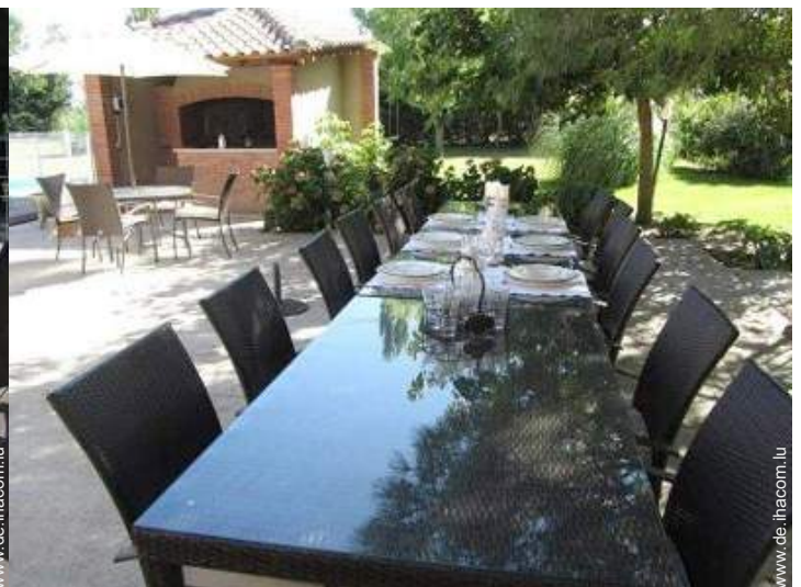
Außenausstattung zur Verfügung der Gäste