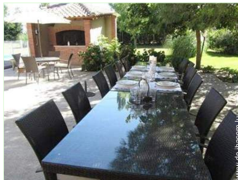
Außenausstattung zur Verfügung der Gäste