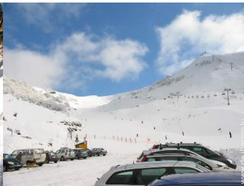
Winteraktivitäten in der Nähe