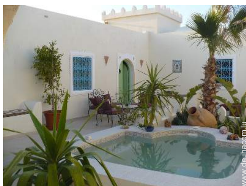
Raumaufteilung zur Verfügung der Gäste