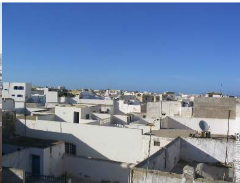
Blick auf Dächer