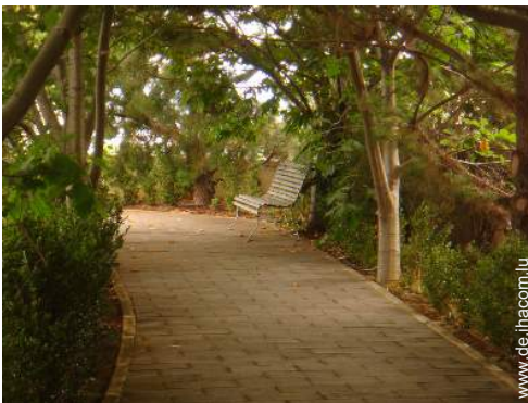
Äußerer Rahmen zur Verfügung der Gäste