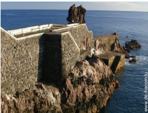
Freizeitaktivitäten in der Nähe