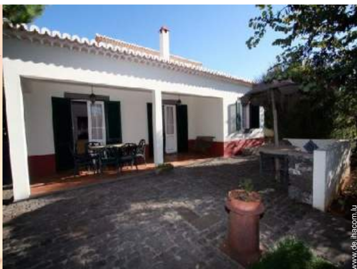
Außenanlage zur Verfügung der Gäste