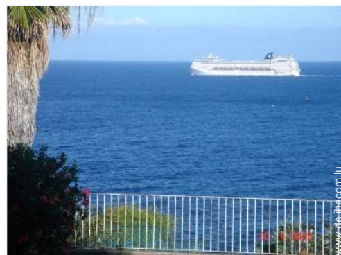
Blick auf Ozean