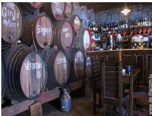
Weinkeller und Weindegustation