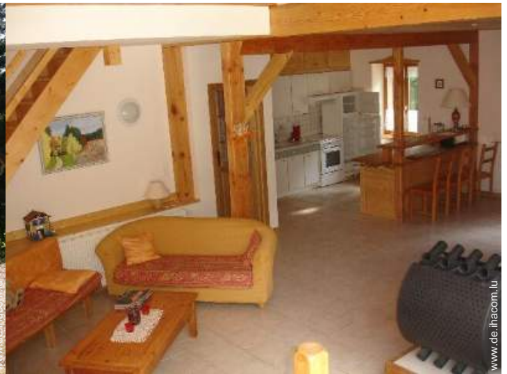
große amerikanische Küche