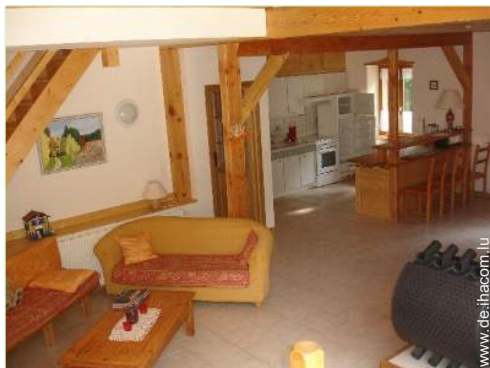
große amerikanische Küche