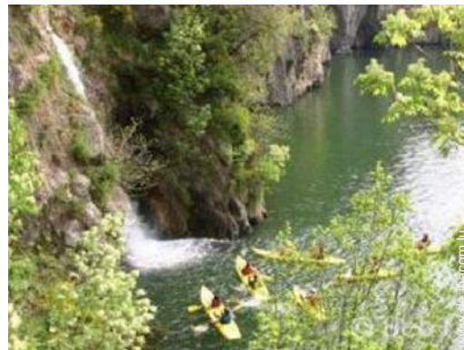
Wassersport in der Nähe