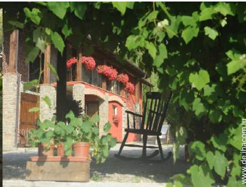
Blick auf Hof