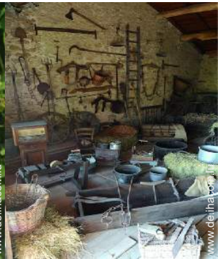
Antiquitäten & Trödel