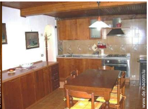
große separate Küche