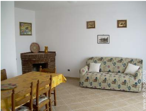
Sofabett(en) 2 Personen