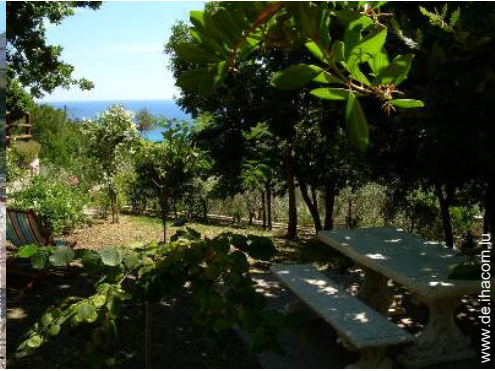
Außenanlage zur Verfügung der Gäste