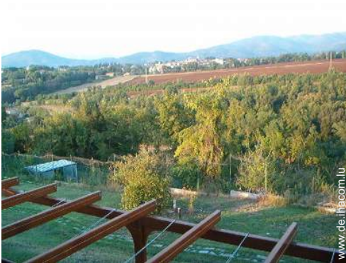
Blick auf Weinberge