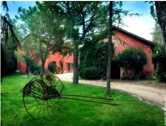
ehem. Bauernhof mit Charme