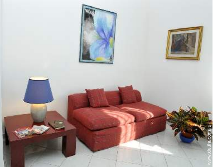
Innenkomfort und Ausstattung