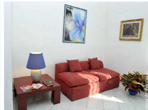
Innenkomfort und Ausstattung