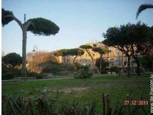
Attraktionen und Entspannung