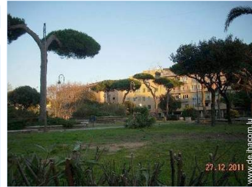
Attraktionen und Entspannung