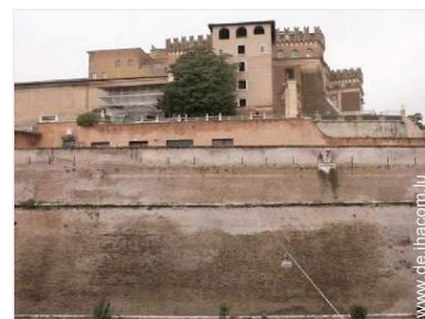
Blick auf Denkmal