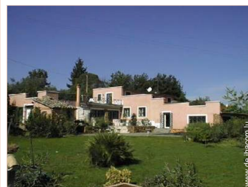
Villa mit Charme