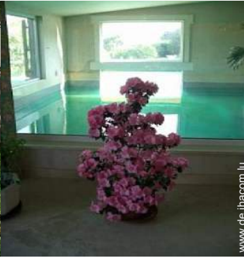
Swimmingpool im Haus