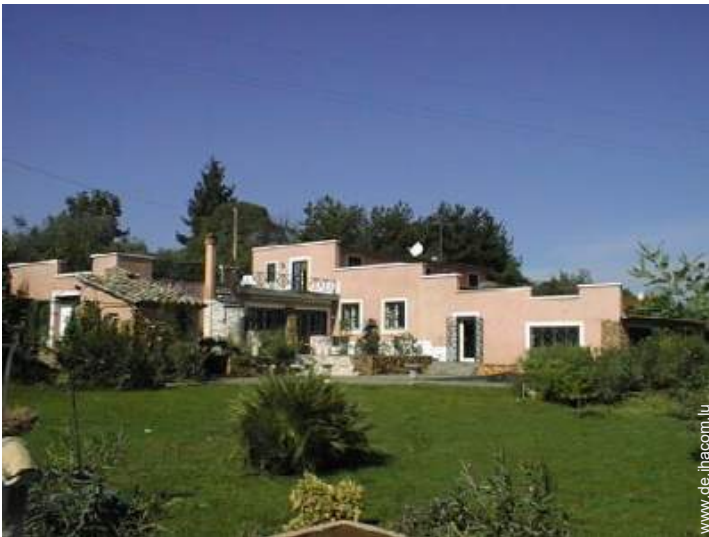
Villa mit Charme