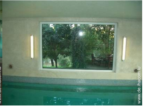
Swimmingpool im Haus