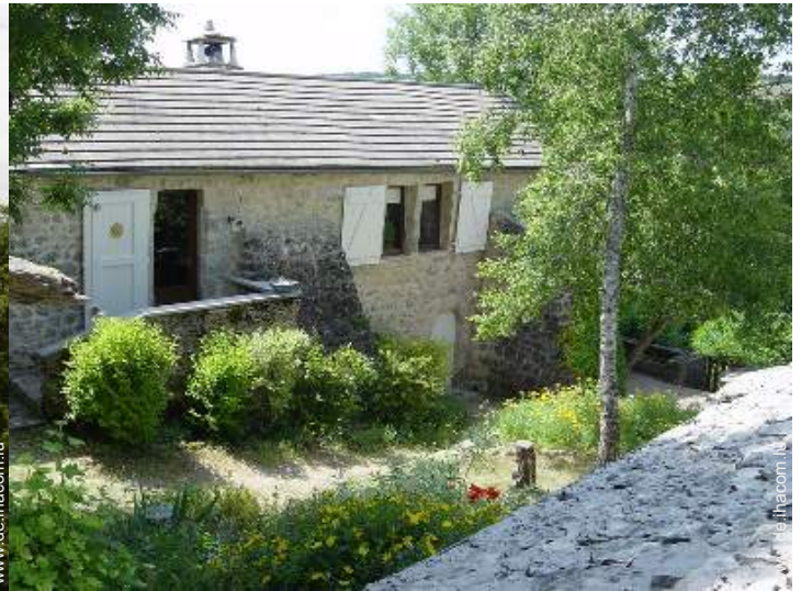
Blick auf Hof