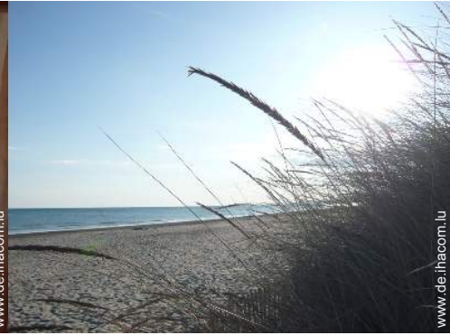
Badevergnügen in der Nähe