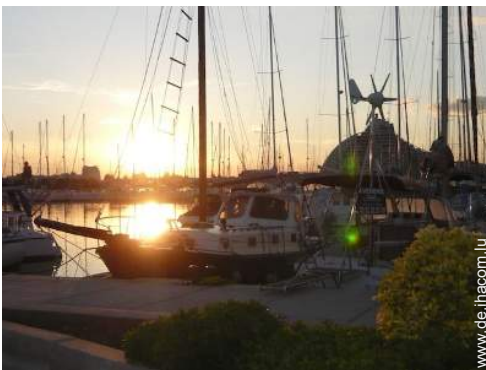
Wassersport in der Nähe