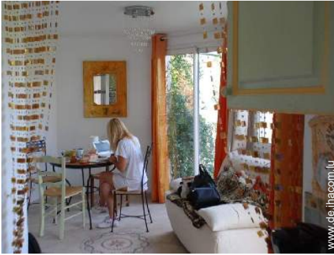
Innenkomfort und Ausstattung