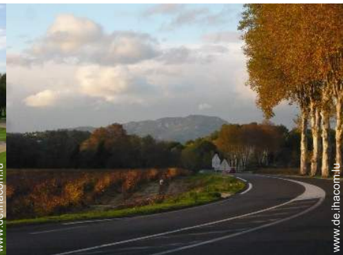
Attraktionen und Entspannung