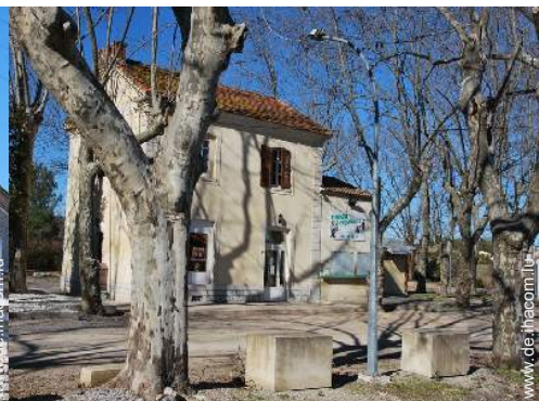
Blick auf Dorf