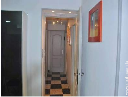
Raumaufteilung und Annehmlichkeiten