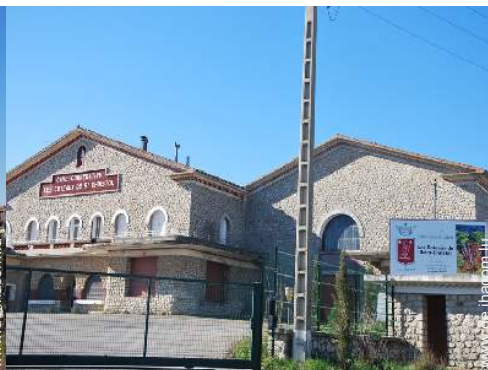
Blick auf Dorf