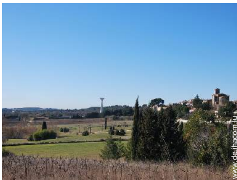
Blick auf Dorf