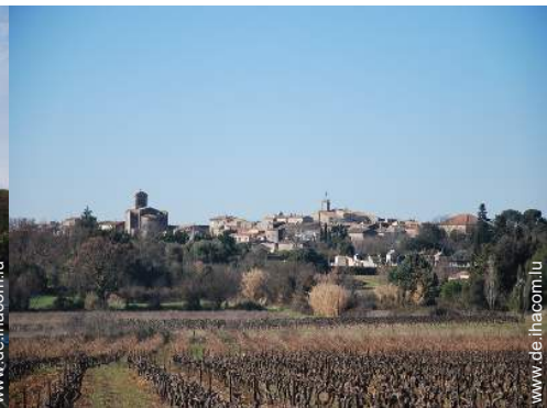
Blick auf Dorf