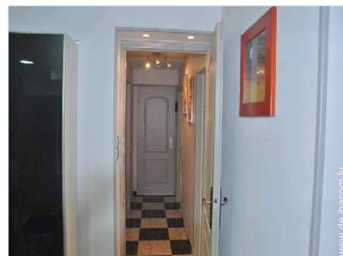
Raumaufteilung und Annehmlichkeiten