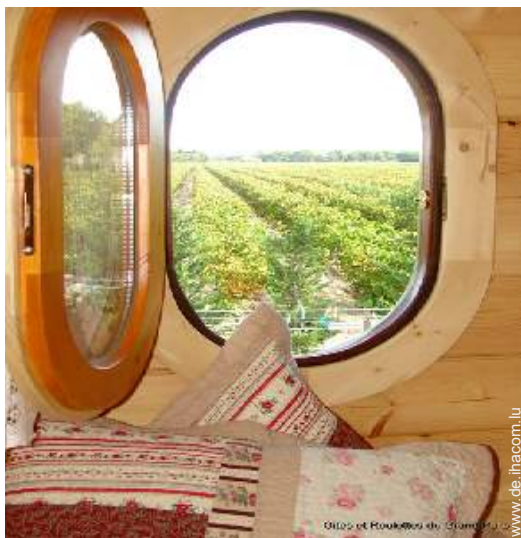
Blick auf Weinberge