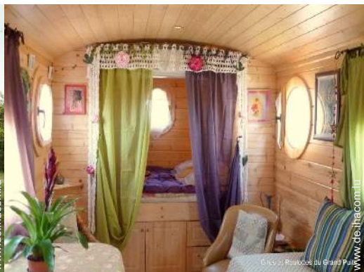
Wohnwagen mit Charme