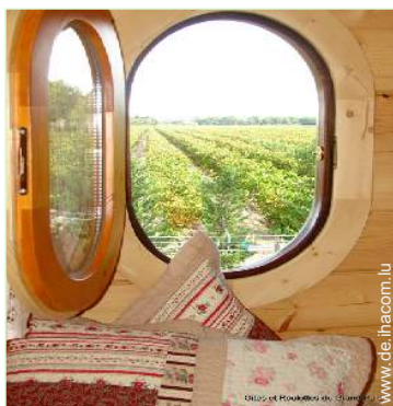
Blick auf Weinberge