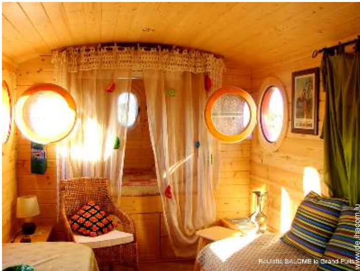
Wohnwagen mit Charme