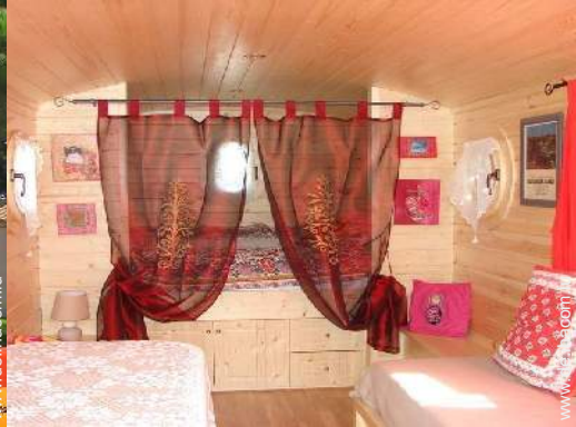
Wohnwagen mit Charme