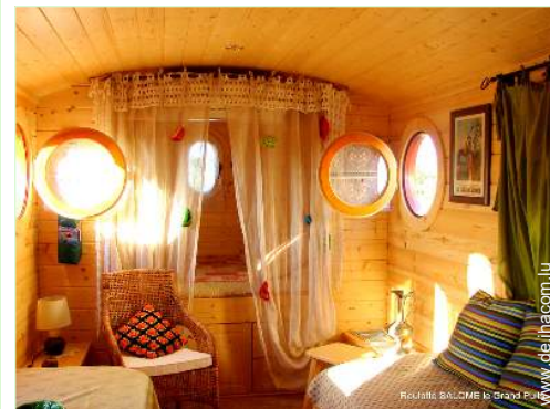
Wohnwagen mit Charme